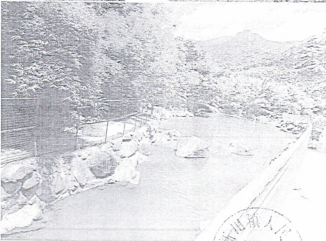
整改后的生态隔离网防护栏