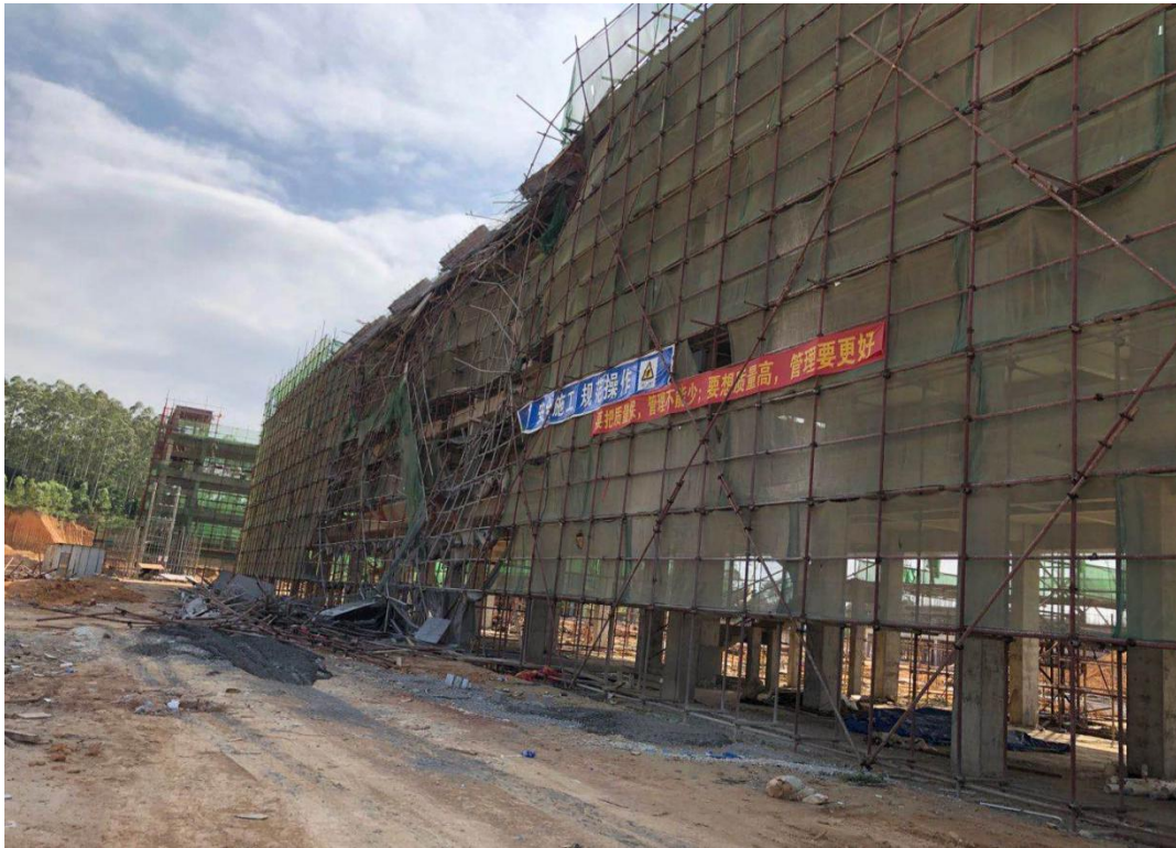
图 2 混凝土、钢管、模板等材料散落至地面