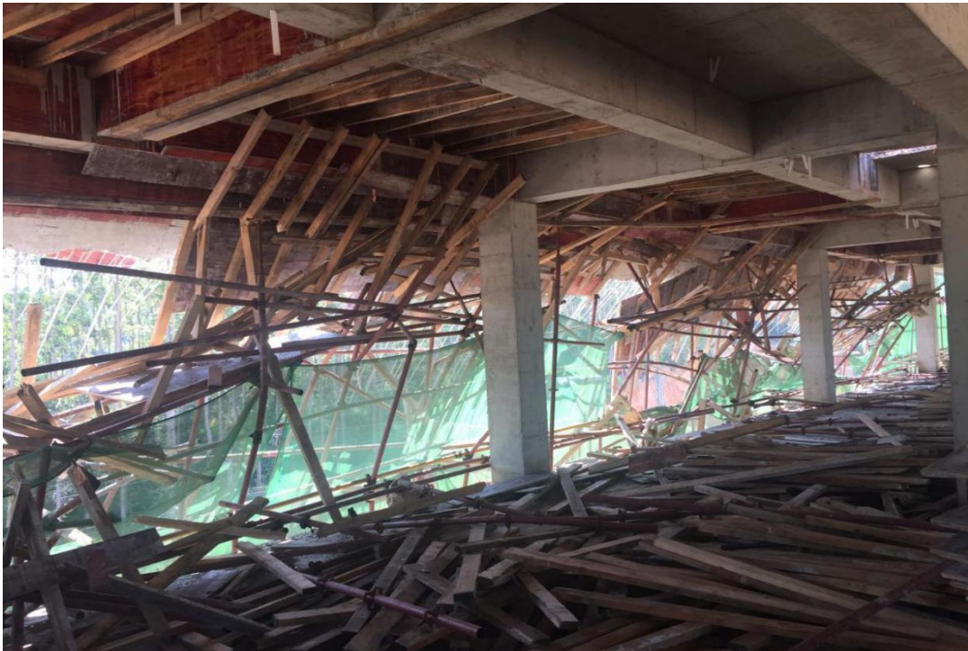
图 3 外脚手架钢管严重变形