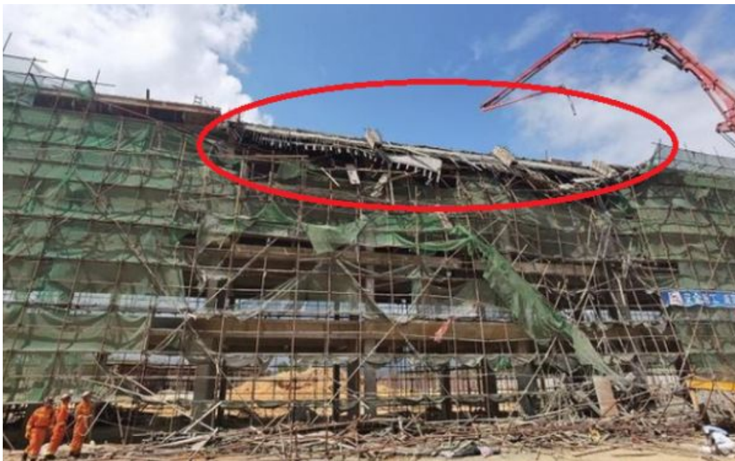
图1 东侧脚手架局部坍塌

该天面构架浇筑混凝土时模板支撑发生坍塌，天面构架作业人员9名（混凝土工8名、泵车控制员1名），其中8名混凝土工跌落至地面，1名泵车控制员跳至屋面层，导致7人抢救无效死亡，2人受伤（其中1人次日抢救无效死亡）。事故现场部分情况见图1-4：