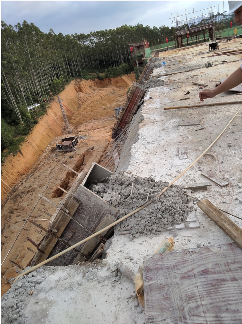
图 4 屋面新浇混凝土框架柱倾覆